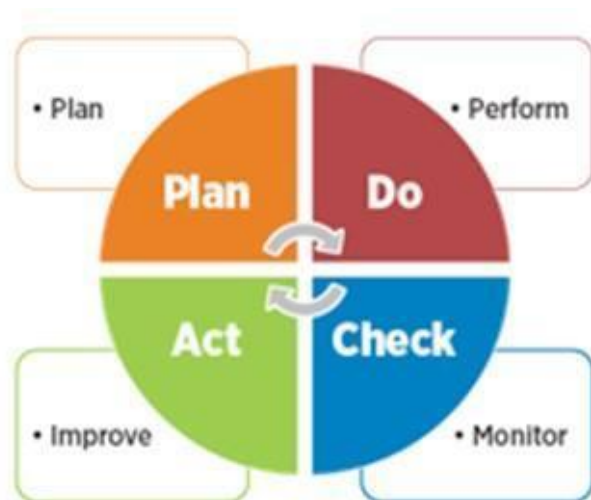
Figure: logical framework of the Plan-do-check-act) method

Struktura logiczna przyjęta do opracowania planu działania w zakresie gospodarki o obiegu zamkniętym to dobrze znana metoda PDCA (Plan-do-check-act), iteracyjna metoda projektowania i zarządzania stosowana w biznesie do kontroli i ciągłego doskonalenia procesów i produktów.